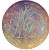
بنسقاب زرین متعلق به دوره ساسانی