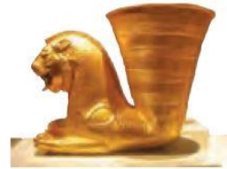
ریون* (تکوک) شیر غزان هخامنشی

در مقابل به تعدادی از مؤلفه‌ها از جمله زیورآلات و لوح‌ها به نسبت دیگر مؤلفه‌ها کمتر توجه شده است. احمدی (۱۳۸۷) درباره‌ی زیورآلات و اشیا تزئینی می‌گوید که ساخت زیورآلات و اشیا تزئینی از هزاران سال پیش در ایران متداول بوده و به‌عنوان هنری گرانبها و ارزشمند برای اقشار مختلف جامعه تلقی می‌شده است. این ساخته‌ها در دوران مختلف از تکنیک فوق‌العاده، نقوش بیاد ماندنی و فرم‌های حیرت‌انگیزی برخوردار بوده‌اند که خلاقیت و توانمندی حیرت‌برانگیز سازندگان این اشیا را نشان می‌دهد، که با توجه به قدمت و فنون به کار رفته در ساخت آنها در کتاب‌های مطالعات اجتماعی دوره اول متوسطه کمتر به آن پرداخته شده است. مورد بعدی لوح‌ها هستند. لوح‌ها آثار ارزشمندی اند که از گل، قیر و دیگر مواد ساخته شده‌اند و در سطحی کوچک‌تر، کارکردی شبیه به کتیبه‌ها و نقش برجسته‌ها دارند و اطلاعات زیادی از زمان گذشته را در اختیار ما می‌گذارند.