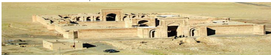
کازرانسرای صرفه در نزدیکی سرخس (استان خراسان رضوی)

کاروانسرا، کتاب مطالعات اجتماعی پایه هشتم، صفحه ۸۸