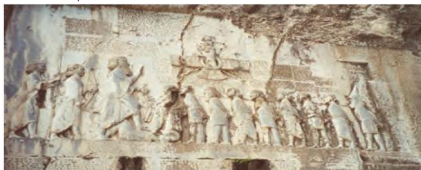
سنگ نگاره و کتیبه داربوس هخامنشی در بیستون؛ داربوس در کتیبه بیستون از ۱۲۳ ایلت تحت فرمان خود نام برده است، مانند پارس، خوزستان (خوزستان)، بابل، مصر، اریتریا (اریتریا)، ارمنستان و ...