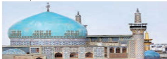
○ مسجد گوه‌رشاد، مشهد

مورد دوم مربوط به کاخ‌هاست. در گذشته مجموعه بناهایی منفرد با نوعی معماری برتر از دیگر بناها احداث می‌شد که کاخ یا قصر نامیده می‌شد (کیانی، ۱۳۹۳: ۱۲). کاخ‌ها مرکز حکومت و محل اداره‌ی مملکت به حساب می‌آمده است. در این کتاب‌ها در بین کاخ‌ها توجه بیشتر معطوف به تخت جمشید است. مورد سوم کتیبه‌ها و نقش برجسته‌ها است. کتیبه‌ها و نقش برجسته‌های مختلف و متنوعی که بر صخره‌ها و کوه‌ها کنده شده از دو بعد قابل اهمیت است، یکی بعد هنری که نشان از شاهکار حجاری آن دوره است و دیگری بعد سیاسی آن که حاکی از تحولات تاریخی دوره‌های مختلف است. با درک و اهمیت جایگاه کتیبه‌ها و نقش برجسته‌های دوره‌های مختلف تاریخی می‌توان تحولات اندیشه و مسائل فکری، فعالیت سازمان‌های دینی و حس زیبایی شناسانه جامعه را در ادوار مختلف تاریخی شناخت (علم‌الهدایی، ۱۳۹۴: ۱۰۴).