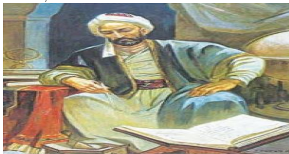
عرواحه نصیرالدین توسی

شخصیت‌ها و مفاخر، کتاب مطالعات اجتماعی پایه هشتم، صفحه ۹۸