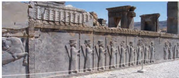
نقش برجسته سربازان سیاه چاوپه‌دان در تخت جمشید

کتیبه و نقش برجسته، کتاب مطالعات اجتماعی پایه هفتم، صفحه ۱۲۶